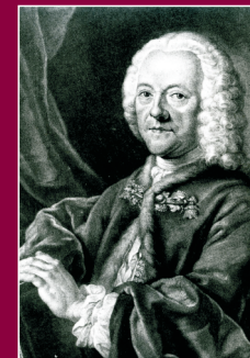
GEORG PHILIPP TELEMANN